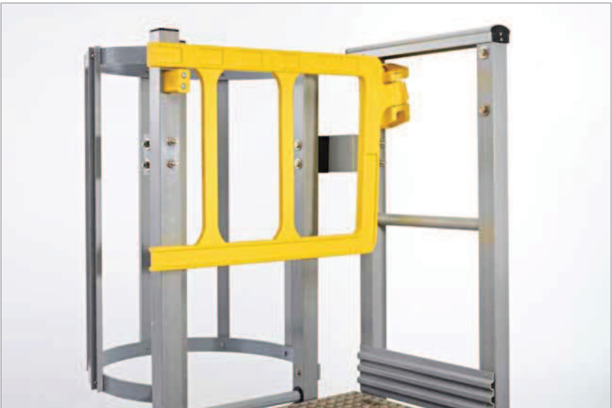
▶ Double Axes Gate