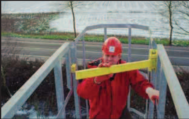
▶ Single Axes Gate apribile a sinistra