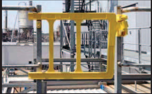
▶ Double Axes Gate / azienda petrolchimica