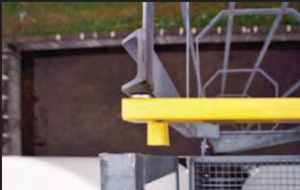
▶ Chiusura magnetica