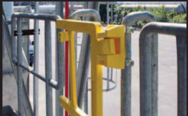
▶ Fissaggi a tubo