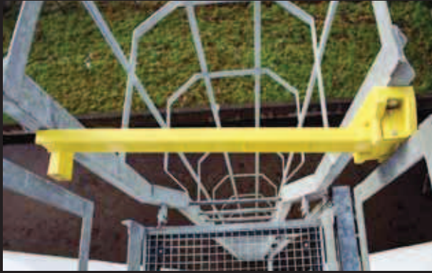
▶ Single Axes Gate / scala alla marinara su silos