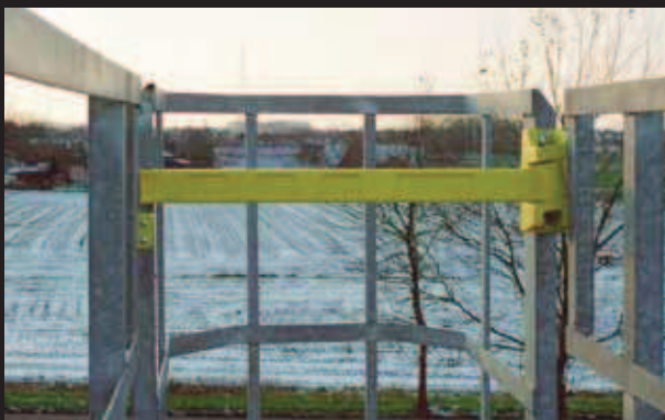
▶ Single Axes Gate