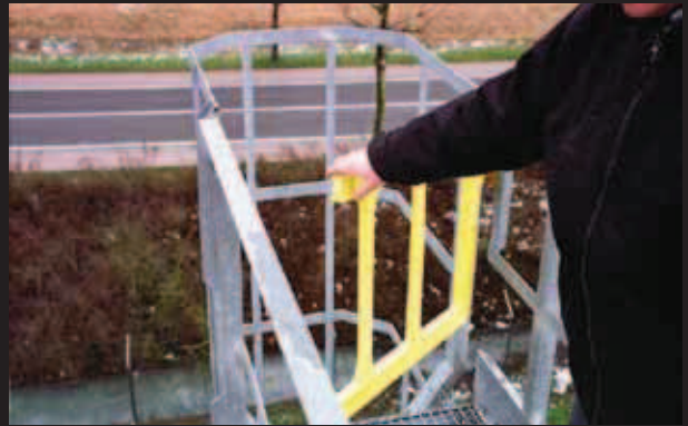
▶ Double Axes Gate apribile a sinistra