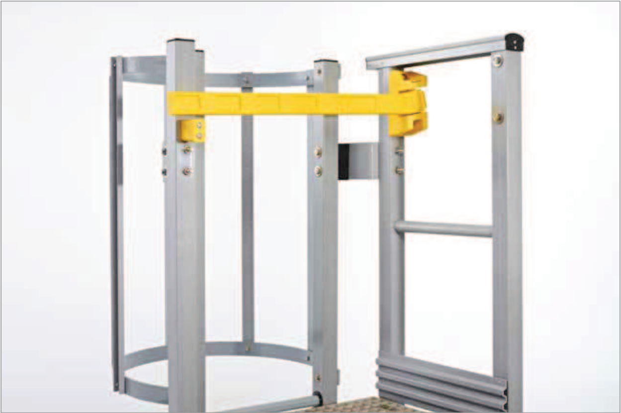
▶ Single Axes Gate