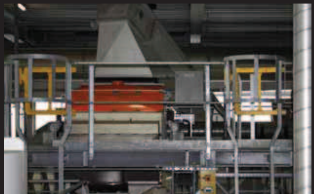
▶ Double Axes Gate / macchinari